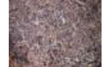
燃料用・ボード用チップ